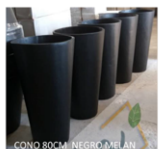
CONO 80CM NEGRO MELAN